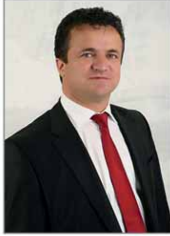
Fatih SELİMOĞLU Belediye Başkanı