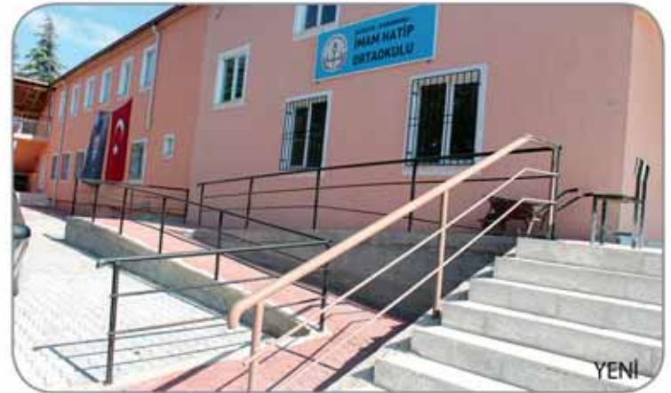
Tüm okullarımızı öğrencilerimiz için hazırladık. Çalışmalarımız devam etmektedir.