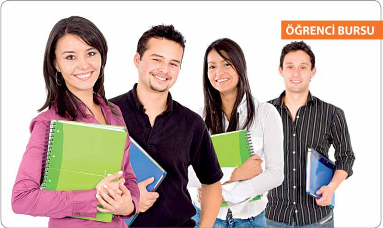
Üniversitede okuyan ve burs almayan ihtiyaç sahibi ailesi Karamanlı'da olan öğrencilerimize burs imkanı sağladık.