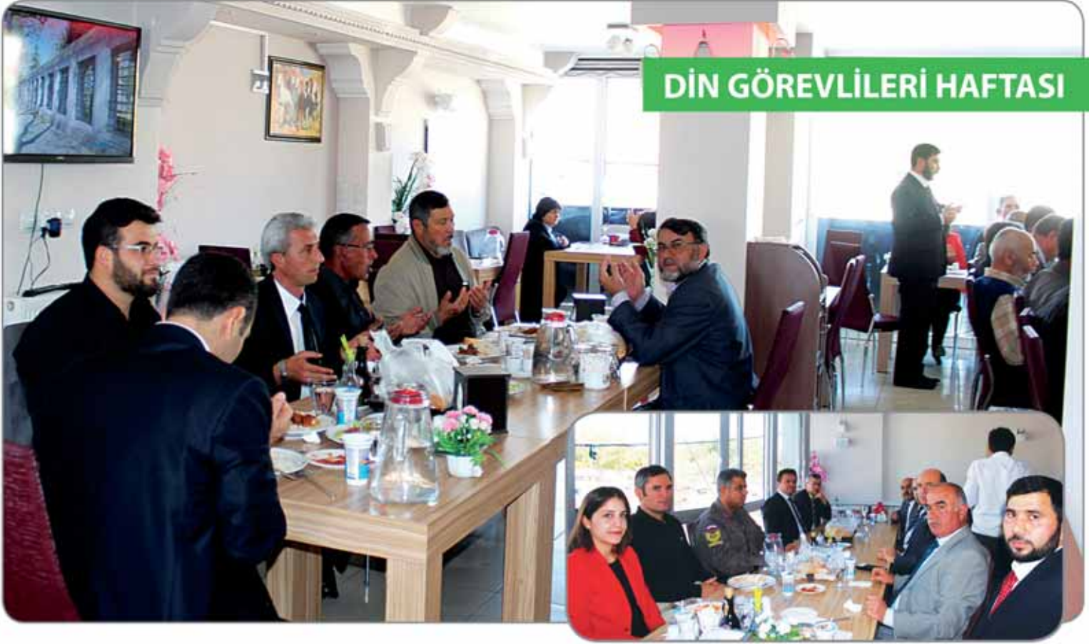
Din görevlileri haftası kapsamında; ilçemiz ve köylerinde görev yapan din görevlileriyle bir araya geldik.