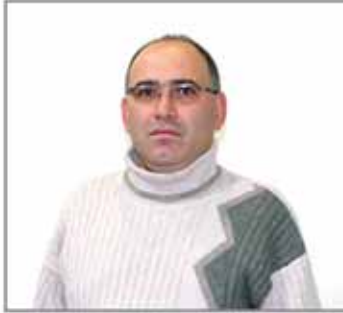
Hüseyin UĞUREL Adalet ve Kalkınma Partisi