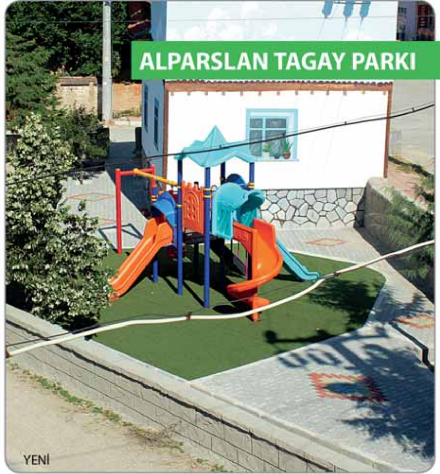
Zafer Mahallesinde bulunan Şehit Hava Pilot Teğmen Alparslan TAGAY parkını tamamladık.